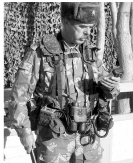
Составные части комплекта УВКТС на пограничнике.