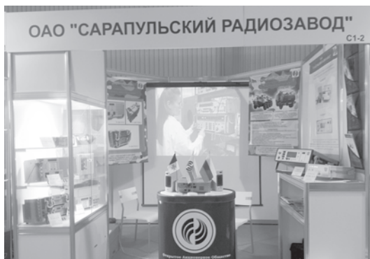
Павильон завода на выставке

30х30 метров под специально подобранную музыку.