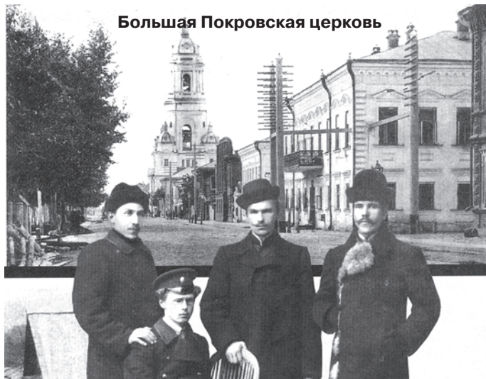
Большая Покровская церковь

Осенью 1812 года отдельными партиями в губернию стали поступать пленные наполеоновской