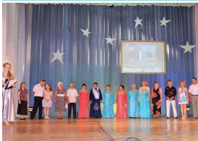
Участники конкурса песни