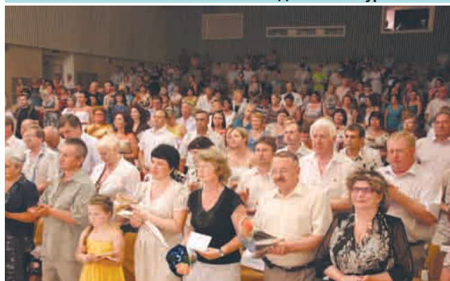
В завершение вечера исполняется песня, ставшая гимном завода