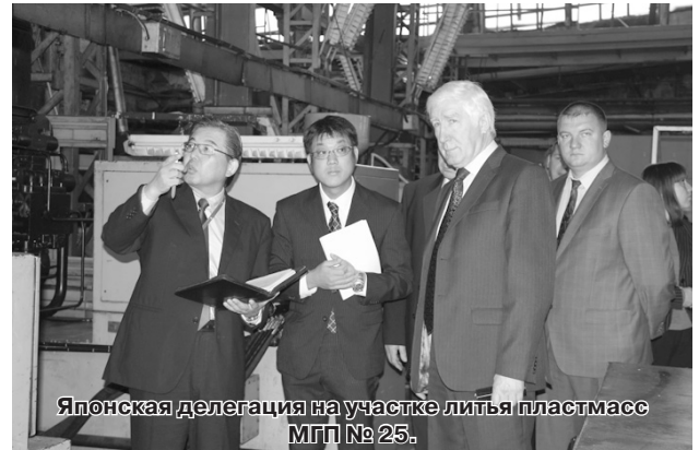
Японская делегация на участке литья пластмасс МЛП № 25.