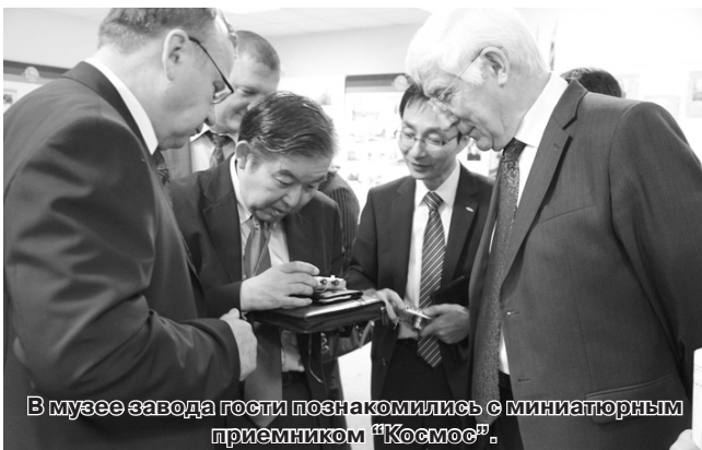
В музее завода гости познакомились с миниатюрным приемником «Космос».