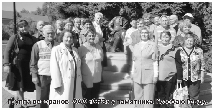
Группа ветеранов ОАО «СРЗ» у памятника Кузебаю Герду.