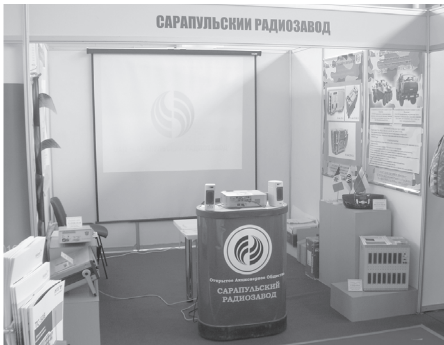
Павильон завода на выставке

Выставка была представительной и прошла на высоком уровне. Всего на ней выставлялись 236 организаций-участников из более чем 25 стран мира. ОАО «СРЗ» экспонировалось на самостоятельном стенде. Главная тема экспозиции – системы, комплексы подвижной связи, как вновь создаваемые, так и модернизируемые - была представлена плакатами, рекламными материалами, видео и слайд-фильмами.