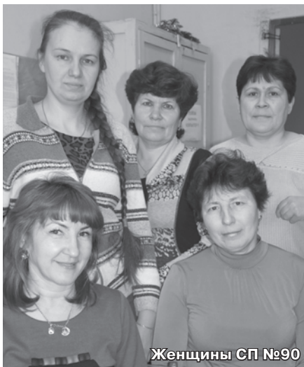
Женщины СП №90