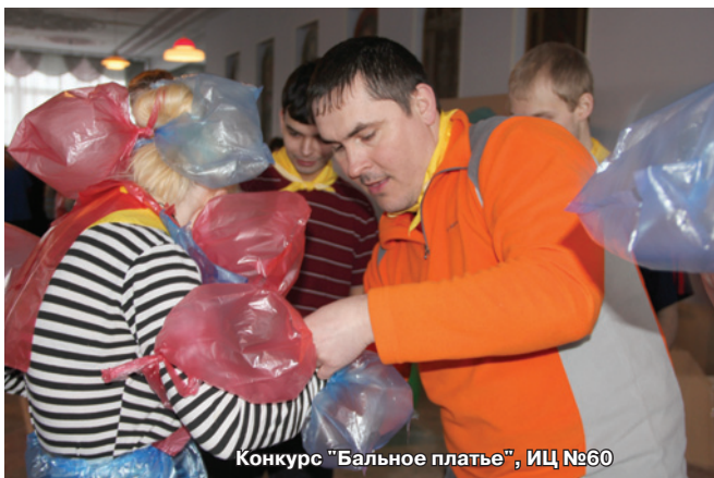
Конкурс "Бальное платье", ИЦ №60