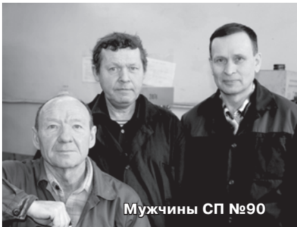
Мужчины СП №90