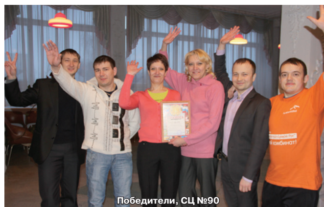
Победители, СЦ №90