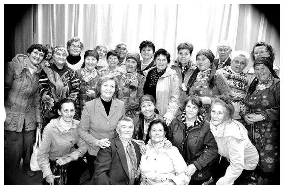
Ветераны завода в гостях у "Бурановских бабушек"