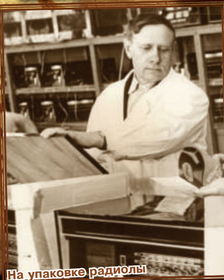
На упаковке радиолы