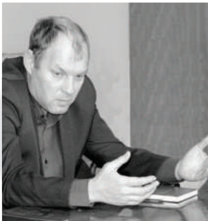
Обеспечение рабочих инструментами

Продолжается планомерная закупка новой вычислительной техники - ежегодно закупается 150 - 200 единиц. Мы планируем организовать так называемые шоу-румы для показа наших инновационных разработок и проведения переговоров и заодно отремонтируем весь блок (помещения МТО №39). В следующем году на подобной встрече сможет присутствовать уже около 300 человек, так как будет открыт конференц-зал на четвертом этаже корпуса 2А. Это лишь неполный перечень планируемых на заводе мероприятий.