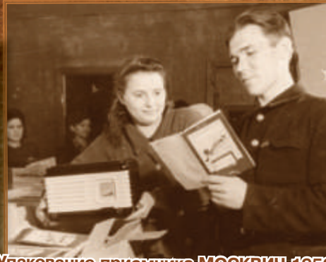
Упаковка приемника МОСКВИЧ 1950 г.