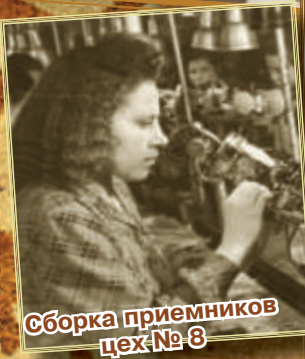
Сборка приемников цех № 8