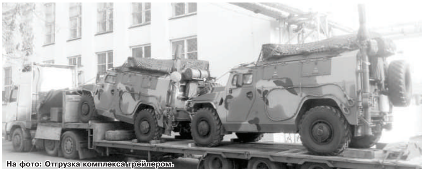
На фото: Отгрузка комплекса трейлером.