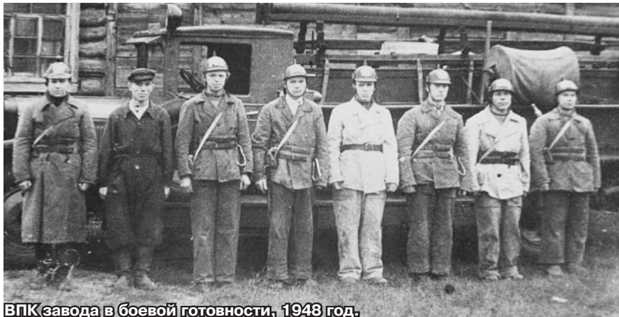
ВПК завода в боевой готовности, 1948 год.