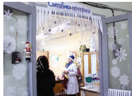
Отдел технической документации