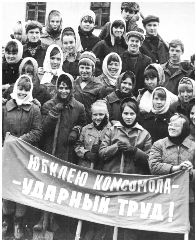
Комсомольцы - строители общежития в микрорайоне Дачный. 1968 год.

29 октября 1918 года на первом Всероссийском съезде союзов рабочей и крестьянской молодёжи был создан Всесоюзный Ленинский Коммунистический союз молодёжи (ВЛКСМ).