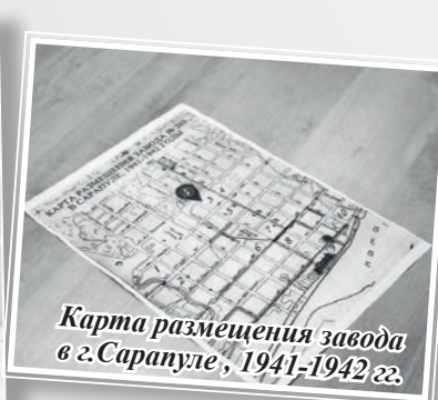
Карта размещения завода в г.Сарапуле, 1941-1942 гг.