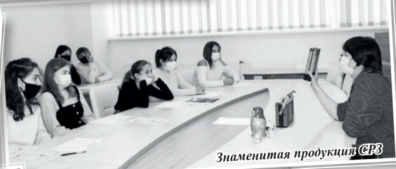
Знаменитая продукция СРЗ