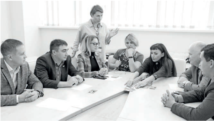
Участники обсуждают характерные черты лидера и руководителя

Во второй части рабочей встречи специалисты завода рассмотрели пять ступеней управления изменениями - объяснить, побудить, обучить, поддерживать и закрепить виды реакций персонала на происходящие изменения и как с ними работать. Первое с чего следует начать - это беседа, пояснение, для чего нам необходимы изменения. Здесь участники выделили такие позиции, как увеличение прибыли, необходимость идти в ногу со временем и угрозу остаться без заказов, если не меняться. Затем следует побудить работника к участию в процессе внедрения изменений. Здесь необходима личная мотивация, которая может выражаться в заинтересованности работника в возможном карьерном росте, улучшении социальной составляющей, увеличении зарплаты. Возникает следующая задача: замотивированный работник нуждается в обучении. В этом призвана помочь система наставничества, курсы повышения квалификации, тренинги, примеры других успешных предприятий. На первых порах новая организация работы невозможна без ошибок, поэтому четвертая ступень призвана поддержать работника через усиление материальной и социальной мотивации, обеспечение ресурсами, признание в виде общественных поощрений, регулярное информирование об успехах процесса через СМИ. Заключительной, пятой, ступенью управления изменениями является закрепление положительного результата в организации через бригадные соревнования, конкурсы, распространение новых форм на другие производства организации.