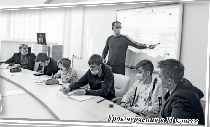
Урок черчения в 11 классе