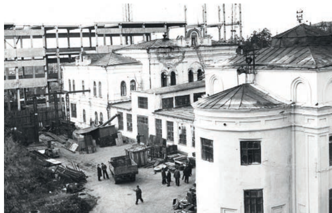
Строительство корпуса № 9.