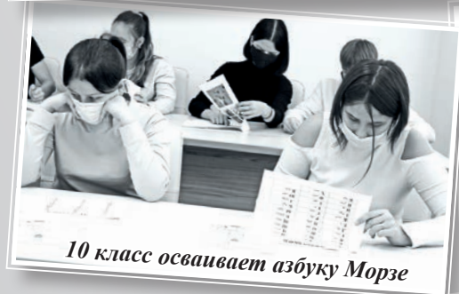
10 класс осваивает азбуку Морзе