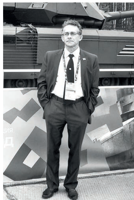
На форуме «Армия-2018»

не только с оружием в руках, но и с помощью всего своего арсенала - интеллекта, таланта, души» (Алексей Кортнев, «Несчастный случай»).