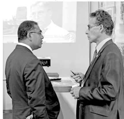
С представителем МО Кампуции

«Жизнь - это то, что случается, пока ты строишь планы» (Джон Леннон, The Beatles).