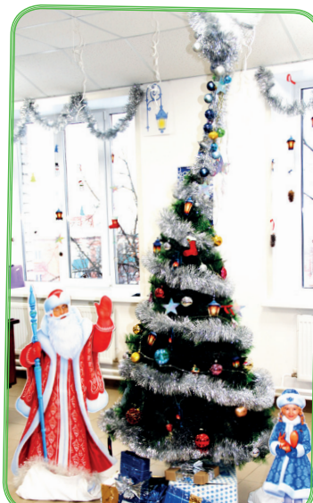
Отдел № 51 (типография)