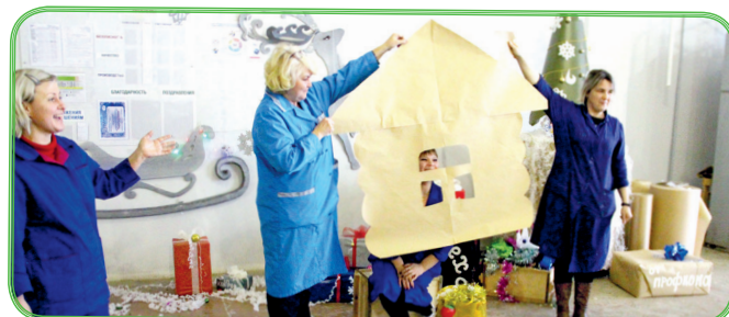
МГЦ №25 (малярный участок)