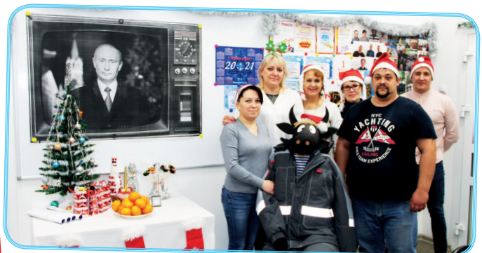
КБ №62 (монтажный участок)