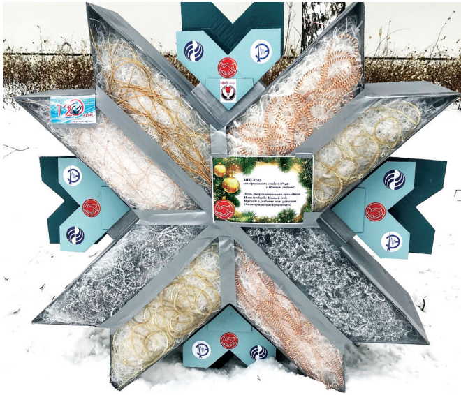
«Снежинка - кружевная льдинка» МГЦ №25 (техбюро)

В преддверии Нового года профком СПЗ организовал конкурс новогодних снежинок среди подразделений АО «СПЗ» с целью повышения творческой активности работников, развития и укрепления корпоративной культуры, а также создания праздничной атмосферы в организации.