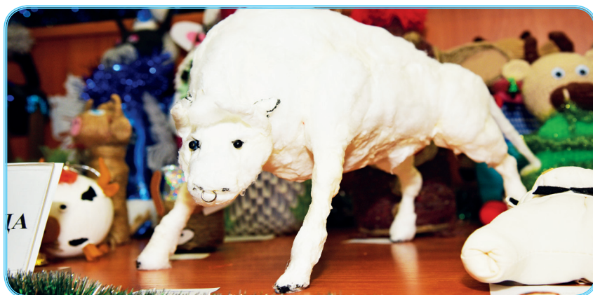
«Северок» М. Бакиловой