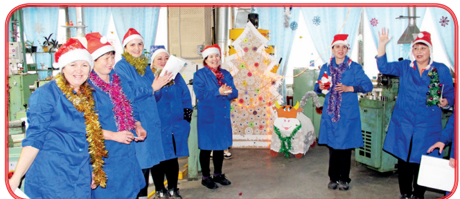
МГЦ №25 (токарно-револьверный участок)