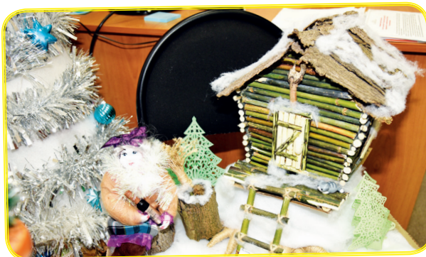
«В гостях у сказки» канцелярии ОУП №34