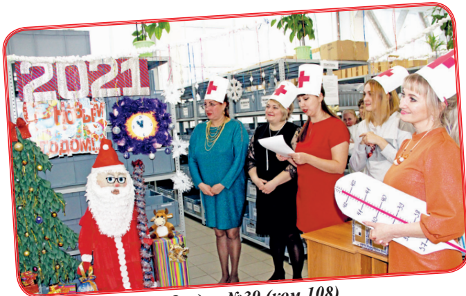
Отдел №39 (ком.108)