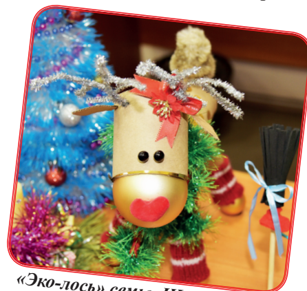
«Эко-лось» семьи Щипицыных