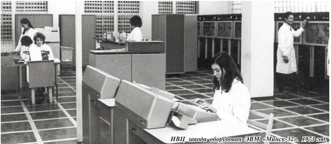
ИВЦ завода-оборудован ЭВМ «Минск-32», 1973 год.