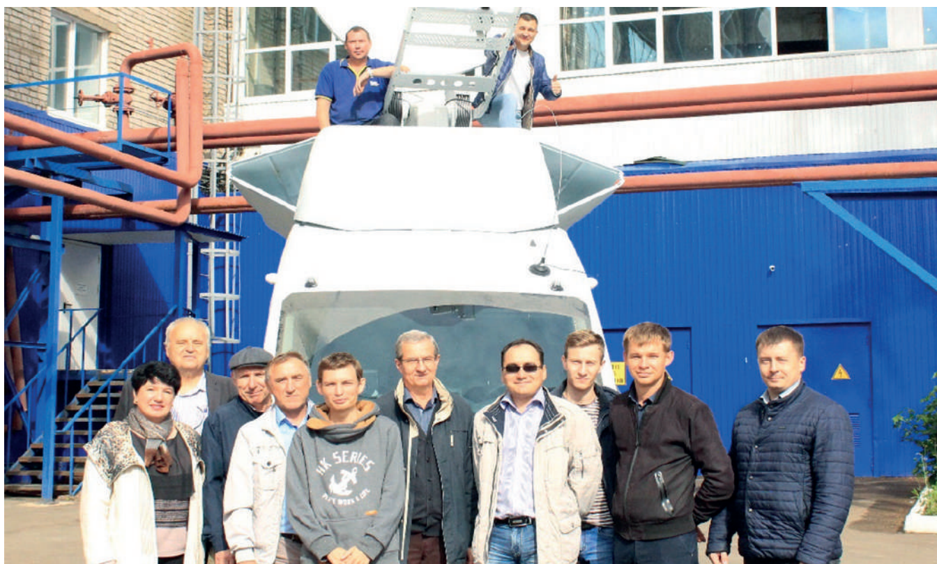
На фото коллектив разработчиков и сборщиков современного мобильного узла связи.