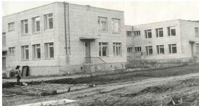
Благоустройство территории детского сада «Сказка»

«Бригада цеха №5 мастера Л.В.Чигвинцевой за успешное выполнение производственного задания, высокую производительность труда и качество продукции занесена на Доску почёта УАССР. Кроме того, бригада признана победителем среди бригад республики».