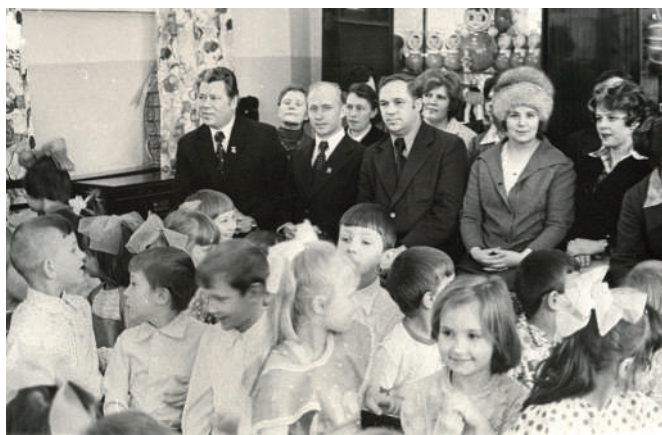
Открытие детского сада «Росинка»

(Примечание: сегодня в здании этого сада находится Прогимназия №10.)