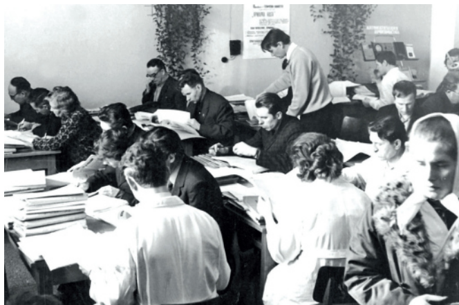
Ярмарка идей в библиотеке. 1978 год