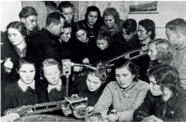
Занятия в техникуме. Изучение устройства электропилы