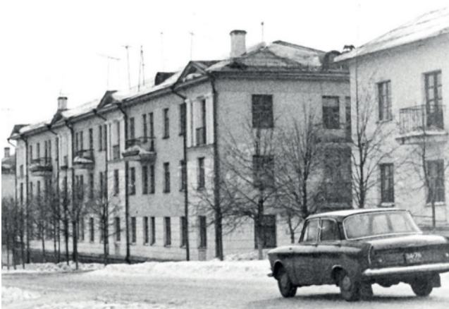
Новые жилые дома на ул. Интернациональная. 1958 год.