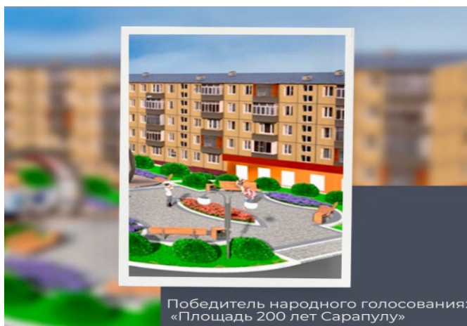
Победитель народного голосования: «Площадь 200 лет Сарепулу»

Наибольшее количество голосов набрала «Площадь 200 лет Сарепулу». Таким образом, в 2023 году здесь появится обновлённая территория и комфортная пешеходная инфраструктура с зонами отдыха для детей и взрослых.