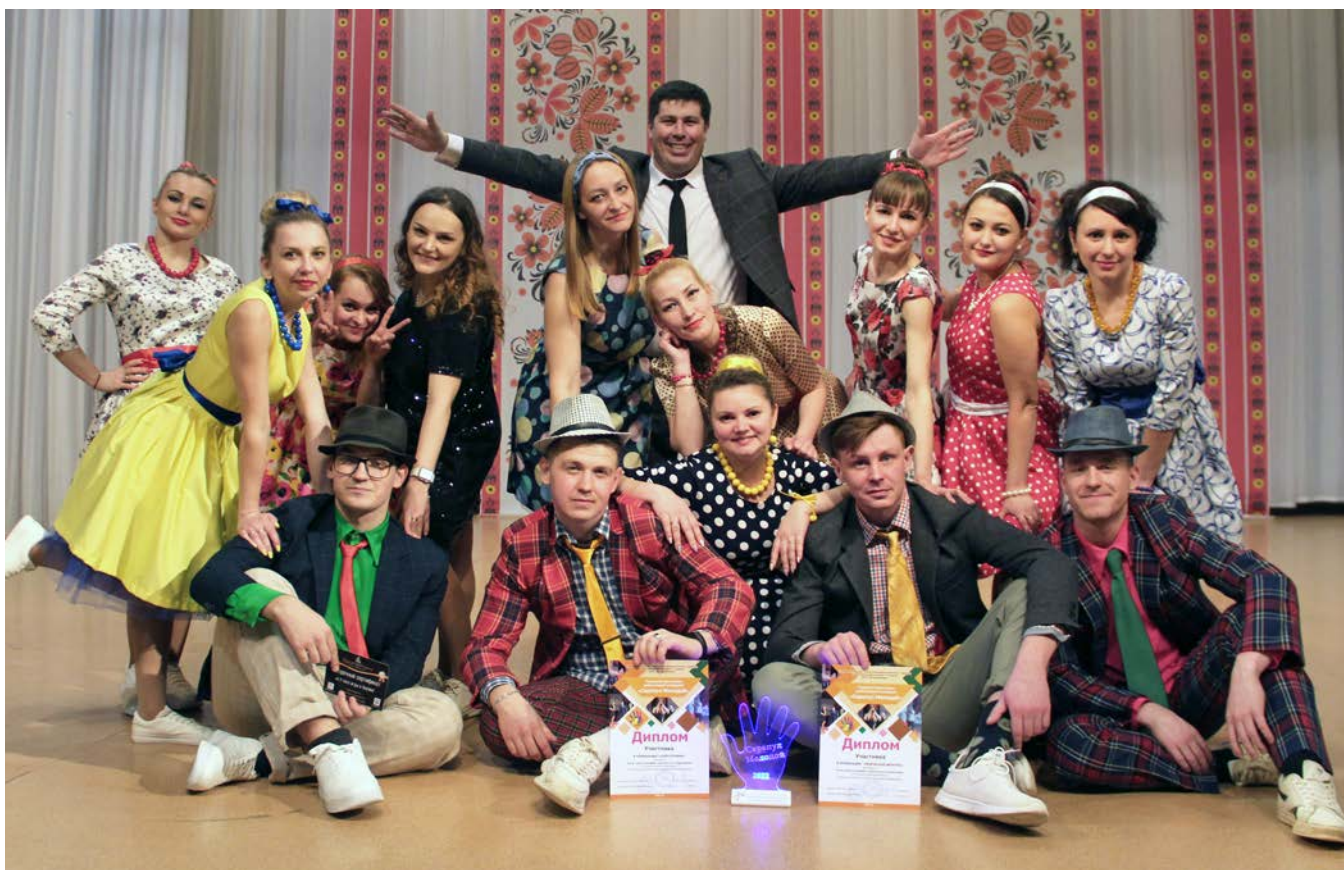
Стиляги. Актив молодёжи СРЗ на фестивале «Сарапул молодой-2022».