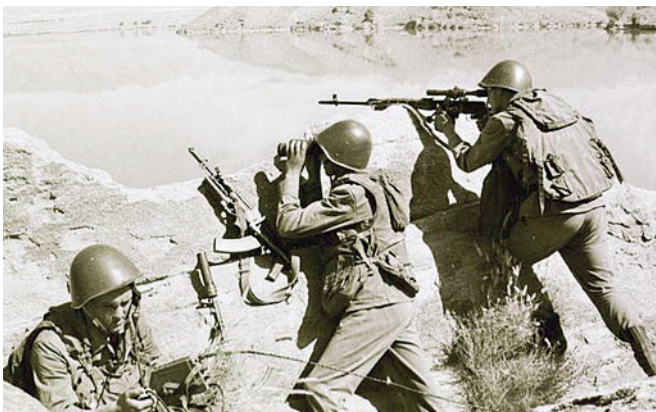
Применение радиостанции «Северок» в реальных боевых условиях

«Северок-К» дал начало целому семейству радиостанций: появился модернизированный вариант «Северок-КМ». Позже на предприятии выпускался «Северок-КМП» с прыгающими в случайном порядке частотами.