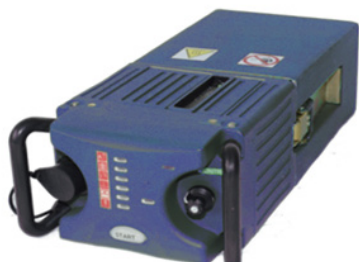
Альтернативный источник энергии

В настоящее время на предприятии реализуются инвестиционные проекты по направлениям медицинской техники, комплектующих для нефтяной промышленности и волоконно-оптических сенсоров для диагностики жидких, газообразных и порошковых сред. Также с учётом сложившейся ситуации, вызванной введением международных санкций, предприятие прорабатывает вопрос импортозамещения гражданской продукции. Основной задачей инвестиционных проектов является увеличение доли продукции гражданского назначения с высокой экономической эффективностью в общем объёме производства.