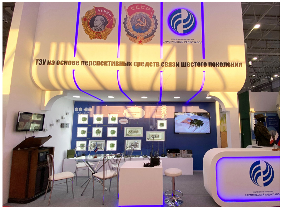
Стенд АО «СРЗ». 2021 год.

Формат 2023 года обещает быть ещё более обширным и предусматривает не только демонстрацию перспективных разработок вооружения, военной и специальной тех-