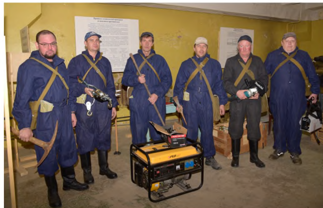
Аварийно-техническое звено к выполнению задания готово!