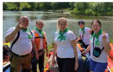
«6-й Кырымский флот»