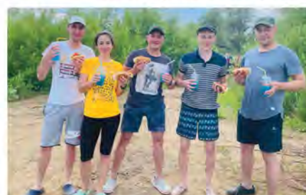
«Гребибля и Гребубля»

Поздравляем членов профсоюза с 55, 60 - лением со дня рождения!