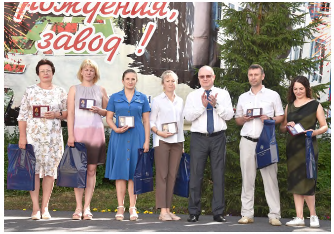
За вклад в развитие системы вооружения ВС РФ