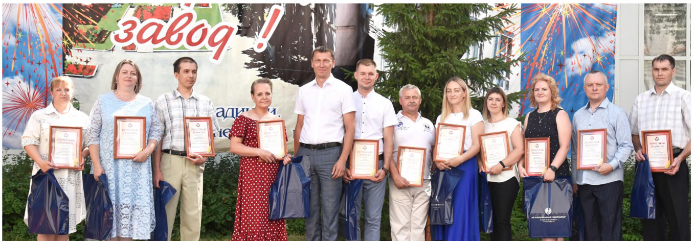
С Почётной грамотой Минпромторга УР