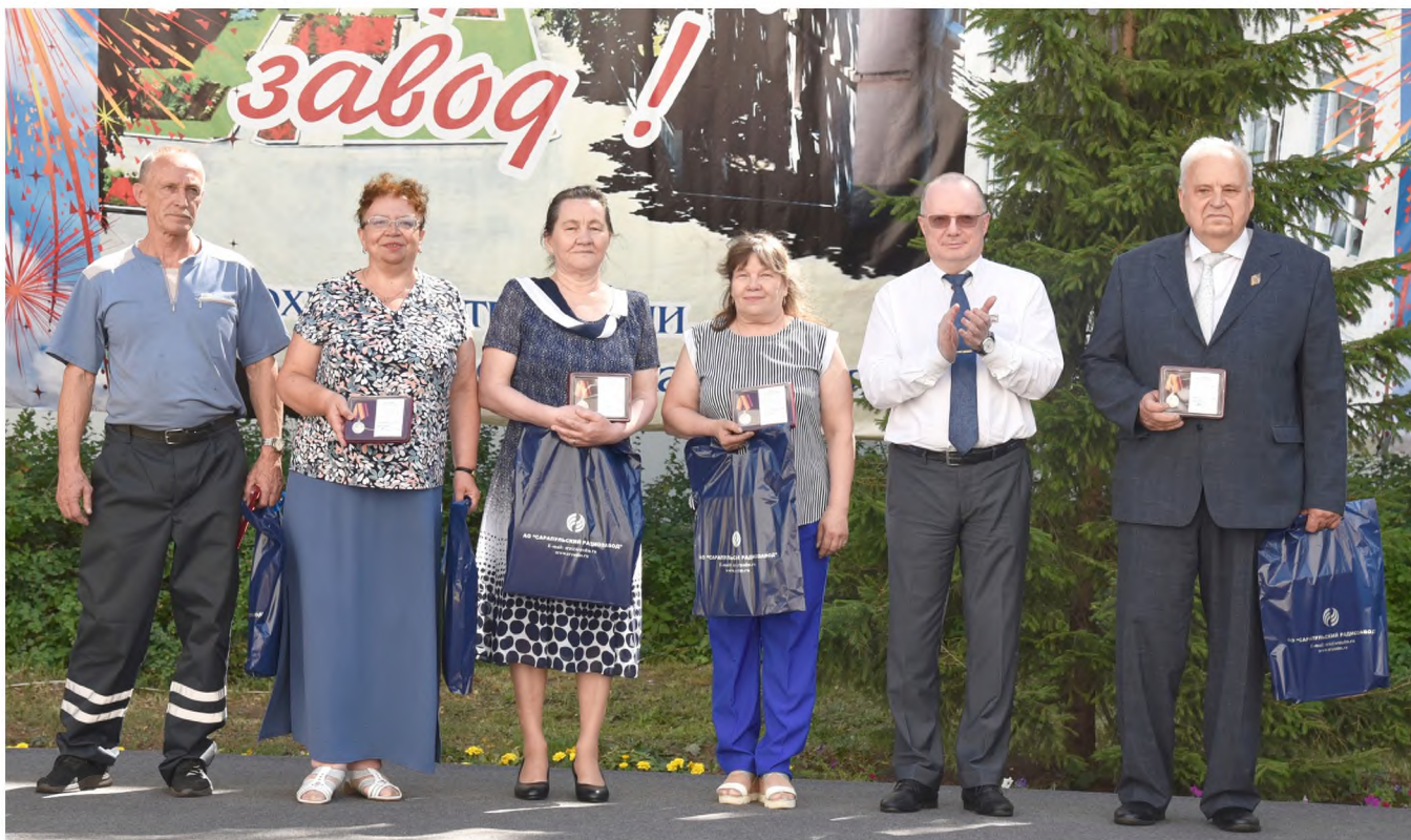
С медалью «Михаил Калашников»

Традиционно, в первую пятницу июля, завод отмечает годовщину со дня своего образования. В этом году заводчане отпраздновали 123-летие предприятия. Тёплая погода объединяет и сама способствует праздничному настроению. С раннего утра на площади завода исполнением знакомых и любимых вокальных композиций в стиле Disco&Pop и Rock работников СРЗ встречала музыкальная кавер - группа «Манхэттен». Собираясь у сцены, заводчане с удовольствием подпевали и пританцовывали в такт музыке.