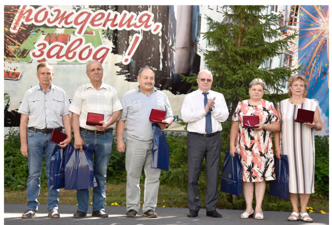
За трудовую доблесть