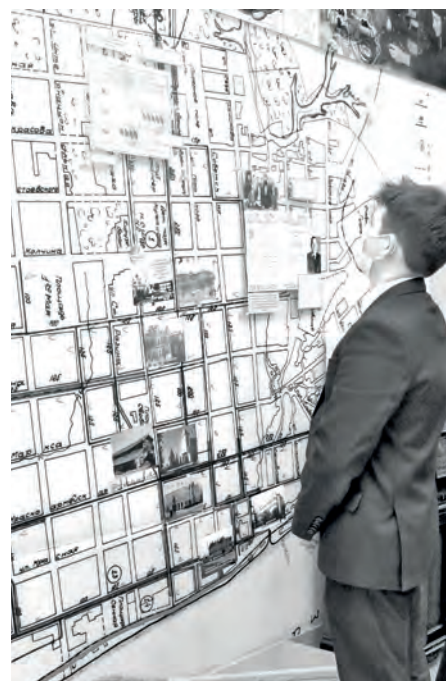
Команда СОШ №13 на экскурсии