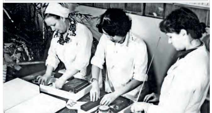
Упаковка радиоприёмника «Урал-авто-2» с олимпийской символикой. 1980 год

К 27 декабря 1982 года заводом было выпущено 1 128 120 штук приёмников «Урал-авто-2». И это безусловный показатель спроса на него у потребителей.