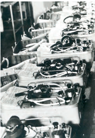
Партия радиостанции «Плот» готовится для отправки потребителю

Вторым изделием заводской «качественной четвёрки» стала аварийно-спасательная радиостанция «Плот». Станция показала надёжность в работе и удобство в эксплуатации, отвечала по техническим и конструктивным данным требованиям времени и соответствовала мировым образцам аппаратуры подобного типа. Проведя многоступенчатую внутривзаводскую аттестацию этого изделия, заводчане уверенно представили его на государственную экспертизу. Предварительно была тщательно выверена и скорректирована конструкторская и технологическая документация, а сдача изделия на контроль с первого предъявления составила 100 процентов в течение двух кварталов года подряд. Всё это обеспечило присвоение радиостанции «Плот» в марте 1972 года Государственно-го Знака качества.