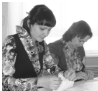
Будущие победительницы конкурса «А ну-ка, девушки» (команда МГП № 25) на одном из этапов - соревнуются в мастерстве украшения стола