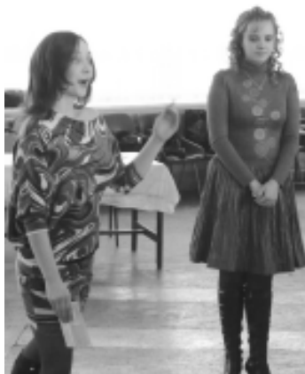
Конкурс «Знакомство», девушки отдела № 56