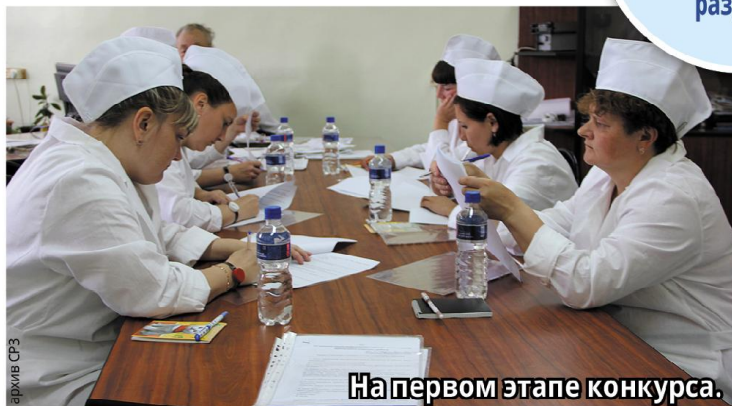
На первом этапе конкурса.

В качестве поощрения всем конкурсантам будут повышены квалификационные разряды.