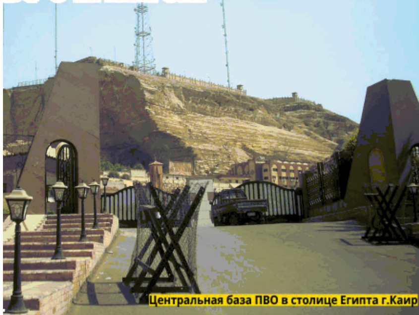
Центральная база ПВО в столице Египта г.Каир

- С Египтом у нас давнее сотрудничество. Поставки различных средств связи в составе военной техники в эту арабскую республику наша компания ведет уже более 40 лет. В настоящее время египтяне намерены продлить срок службы закупленной техники и сделать ее более боеспособной в оперативном режиме. Задача российской стороны, всех, кто участвует в производстве зенитных комплексов, - обеспечить необходимой документацией, обучить их персонал, дать необходимые рекомендации по оснащению участков и рабочих мест. Египет уже провел ряд подготовительных встреч с делегациями предприятий. Настало время показать